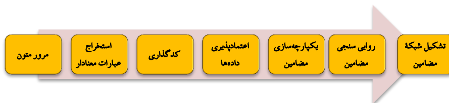
شکل ۱: روند پژوهش

اعتمادپذیری داده‌های کیفی به شیوه‌های زیر انجام شد؛ گردآوری داده‌ها از منابع متعدد و هم‌گرایی بین داده‌ها. شیوه دیگری که به روایی یافته‌های پژوهشی کمک کرد، هم‌سوسازی مضامین به دست آمده از منابع مختلف بود؛ یعنی داده‌هایی که از منابع مختلف به دست آمد، در مرحله مقوله‌بندی یکدست شد و مضامینی که با پژوهش مرتبط نبودند یا خلاف اسناد مکتوب بودند، حذف شدند.